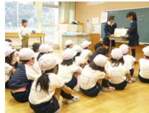
絵本を読んでもらったら...