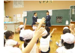
お話のクイズにこたえました！